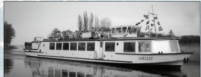
Die neue LORELEY auf der Elde 1996