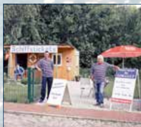
Kartenverkauf 2 (am Parkplatz)