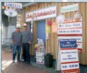
Kartenverkauf 1 (hinter dem Fischverkauf unter der Brücke)

Fahrkarten sind hier, oder an Bord erhältlich