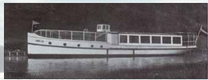
MS LORELEY im Lenzer Kanal 1929

Lassen auch Sie sich von der „Loreley“ verzaubern!